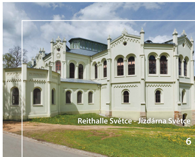
Reithalle Světce - Jízárna Světce

Historický park Bärnau – Tachov vznikl v r. 2010 a je aktuálně největším středověkým archeoparkem v Německu. V Parku