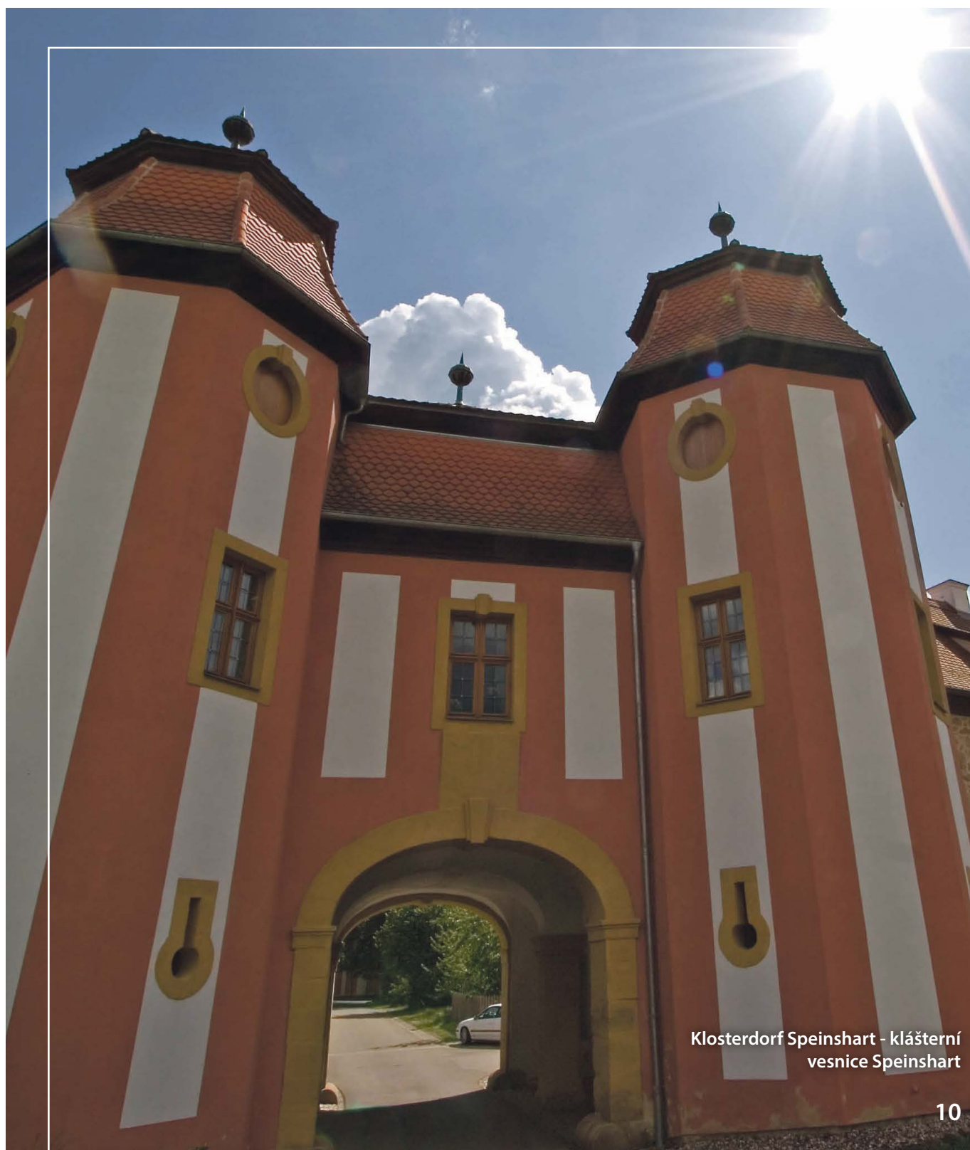
Klosterdorf Speinshart - klášterní vesnice Speinshart