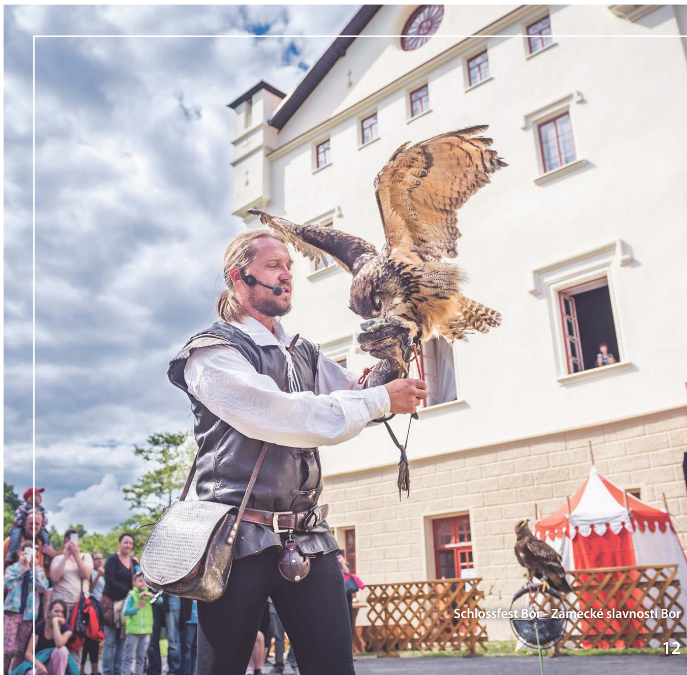
Schlossfest Bor – Zámecké slavnosti Bor