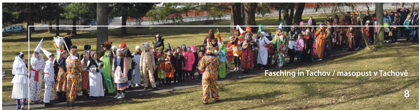
Fasching in Tachov / masopust v Tachově

Objeďte drahocenné poklady z keramiky v Mezinárodním muzeu keramiky ve Weidenu. U příležitosti 30. výročí muzea zde Nová sbírka Mnichov představuje více než 600 jedinečných výrobků z keramiky ze sbírky vévody Františka Bavorského.