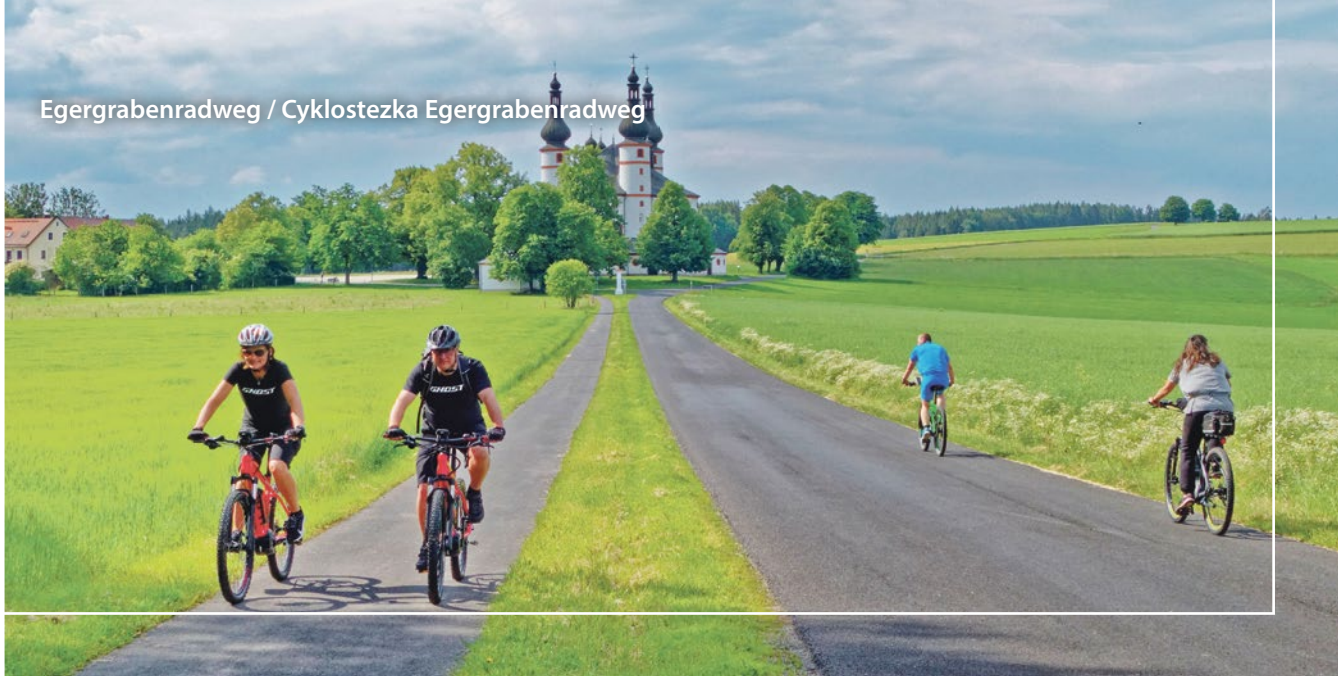
Egergrabenradweg / Cyklostezka Egergrabenradweg

Snowboarder geeignet. Auf der rechten Seite wurde eine Snowboardcrossstrecke mit vielen Sprüngen, Wellen, Steilkurven und mehreren Rails errichtet. Der untere Teil der Piste ist ideal für den Kinderunterricht. http://www.sportoviste-tachov.cz/sjezdovka-vysoka.html