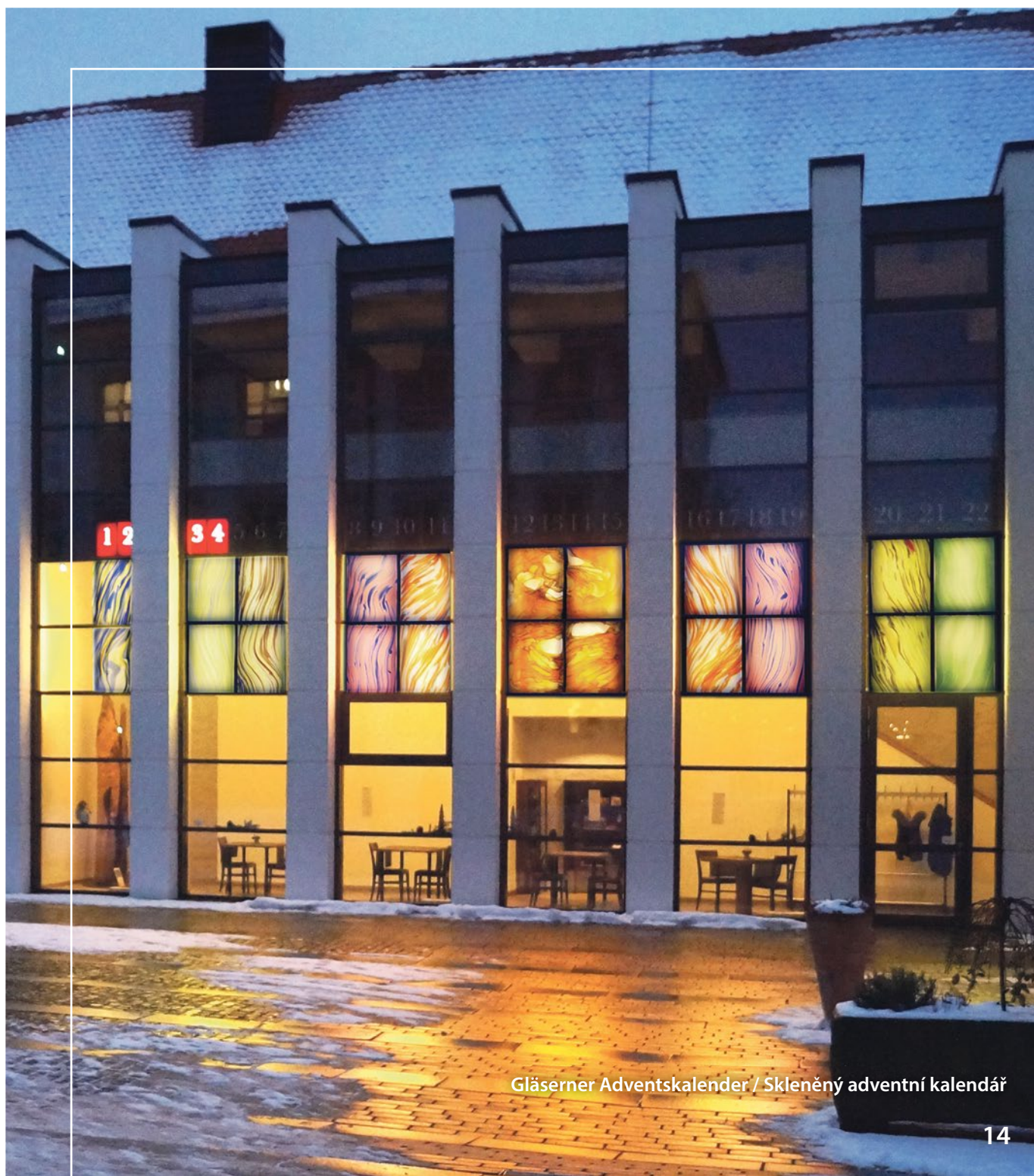
Gläserner Adventskalender / Skleněný adventní kalendář