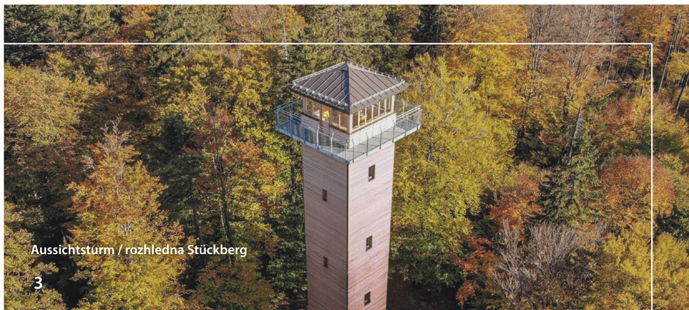
Aussichtsturm / rozhledna Stückberg

projektů, byly navázány nové vztahy. Jsme na cestě ke společnému hospodářskému a životnímu prostoru. Ten se v posledních letech stal jedním z faktorů úspěchu regionu. Projekty jako Euregio Egrensis, Historický park, možnost se zde společně vzdělávat nebo také spolupráce měst Waldsassen/Cheb jsou výbornými příklady. Toto vše je však nutné nadále oživovat právě osobními vztahy, na čemž se chci spolupodílet. A především dále rozvíjet česko-bavorský příhraniční prostor.