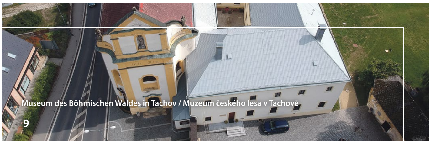
Museum des Böhmisches Waldes in Tachov / Muzeum českého lesa v Tachově

Das bisher größte grenzüberschreitende Projekt war eine gemeinsame deutsch-tschechische Klasse für das Lehrfach Maschinen- und Vorrichtungsmechaniker. Genau vor 10 Jahren wurde das zweijährige aus dem Programm Ziel 3 geförderte Projekt erfolgreich beendet. Mit seinem Umfang und der Intensität der grenzüberschreitenden Zusammenarbeit war das Projekt einzigartig. Deswegen wurden die beiden Partnerschulen – SPŠ, Tachov, Světce 1 und die Europa Berufsschule Weiden von der Euregio Egrensis mit einem Preis gewürdigt. www.sps-tachov.cz